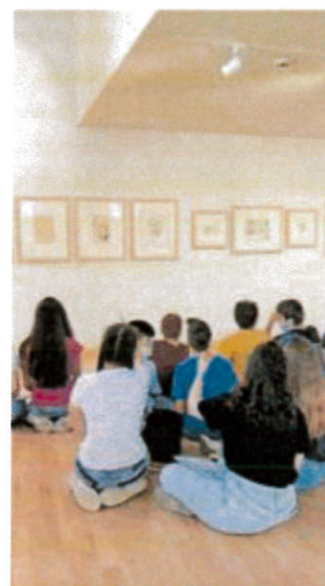
E. G. Giovani visitatori a Ca' Spineda

Suggestivo l'accesso al percorso espositivo, raggiungibile salendo lo scalone dell'architetto Giordano Riccati con gli affreschi di Gaspare Diziani del 1748. Le visite guidate gratuite continueranno anche nel 2024, previa prenotazione al tel. 0422513100 o via mail a fondazione@fondazionecassamarca.it . —