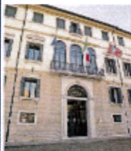
PIETÀ DI RICHIANO Ca' Spineda ha portato molti visitatori in città e tanti studenti hanno fatto da ciceroni